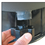
Tubo de desagüe con su tapón, de gran dimensión que sirve como herramienta de desmontaje