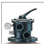
Arena fácilmente accesible gracias al collarín de desmontaje