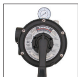
Válvula Vari-Flo™ 6 posiciones